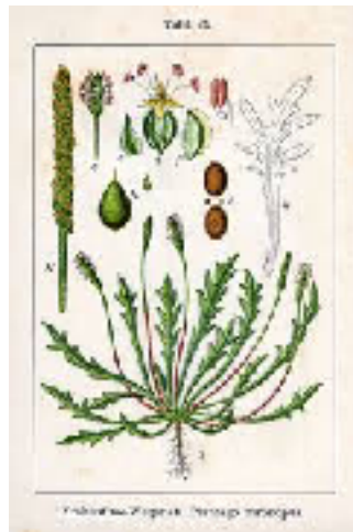
Hertshoornweegbree - Plantago coronopus

Stuur een mailtje naar info@domiestoen.nl . We nemen dan contact met je op. Het is handig om aan te geven waar je interesse naar uitgaat.